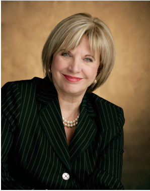
Monsieur François Gendron Président de l'Assemblée nationale Hôtel du Parlement Québec