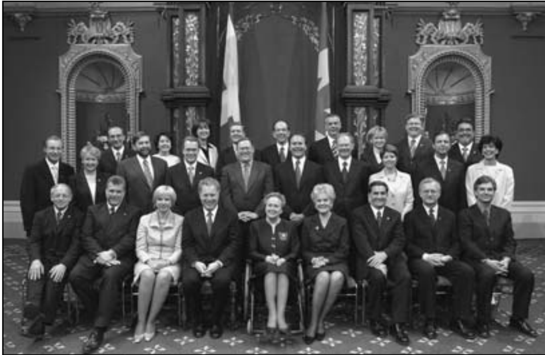
Le Conseil des ministres de l'actuel gouvernement du Québec, assermenté le 29 avril 2003. Ce cabinet était composé de ministres en titre, de ministres responsables et de ministres délégués.

par Jean Lesage en 1960 et que ce n'est qu'en 1971 qu'un document décrit les structures et le fonctionnement du Conseil des ministres. À compter de 1975, un arrêté en conseil officialise le fonctionnement et la procédure. Encore aujourd'hui, un décret concernant l'organisation et le fonctionnement du Conseil exécutif est adopté lors de la formation d'un nouveau Conseil des ministres.