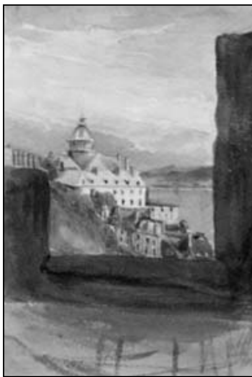
Figure 1 : Québec vu du Château . Juillet 1838. Aquarelle sur mine de plomb, 22,1 x 15 cm, coll. Rideau Hall, Ottawa, prêt permanent du 11 e comte d'Elgin et 15 e comte de Kincardine, K.T. Signé : (coin inférieur droit) MLL / July / 1838 . La vue est prise des ruines du Château Saint-Louis incendié en 1834, soit de l'actuelle terrasse Dufferin.

Les événements entourant le court mandat de lord Durham sont connus et ont été suffisamment discutés pour qu'il ne soit pas nécessaire d'y revenir ici 3 . Retenons seulement que le nouveau gouverneur est arrivé à Québec à la fin mai et qu'il en