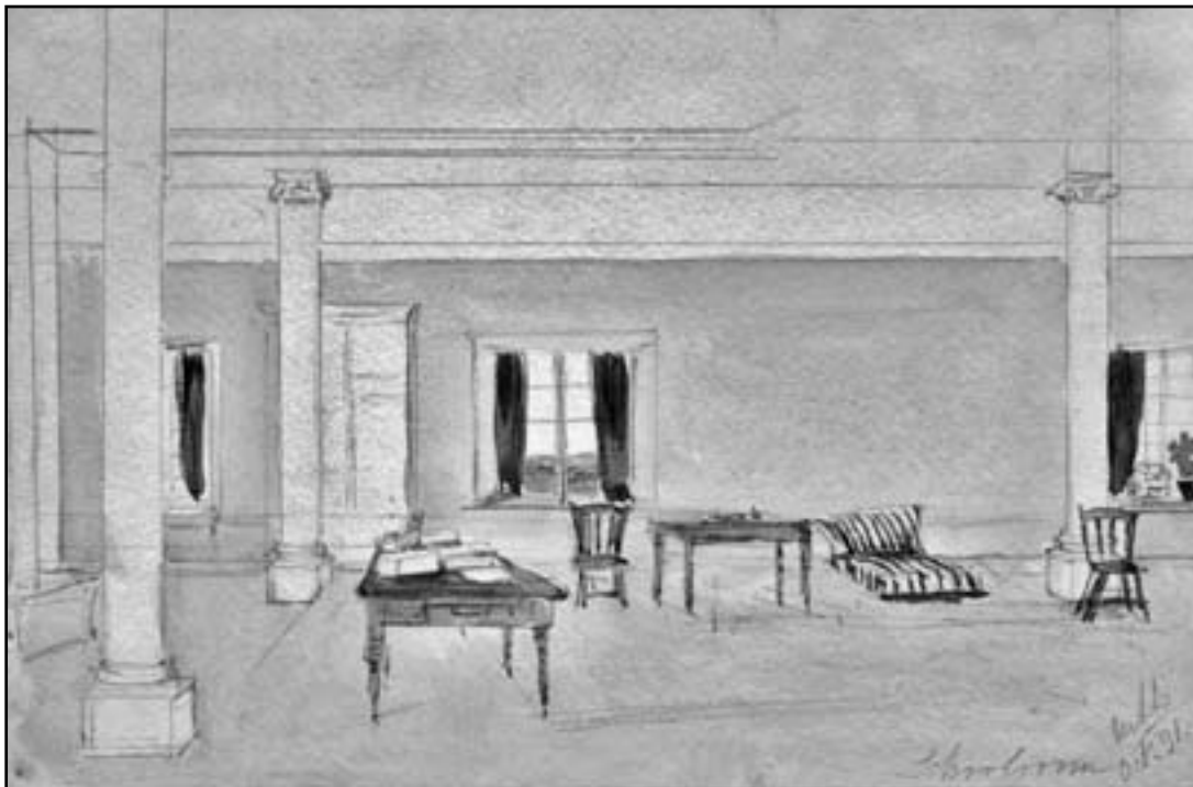
Figure 4 : La Salle d'étude de la famille de lord Durham à l'hôtel du Parlement de Québec, côté jardin. 31 octobre 1838. Aquarelle et crayon sur mine de plomb, 16 x 24 cm, coll. du 11 e comte d'Elgin et 15 e comte de Kincardine, K.T., Écosse. Signé : (coin inférieur droit) MLL / Oct. 31.

occupait une place de choix dans la vie familiale. En effet, on ne compte plus les entrées dans les différents journaux personnels où il est mentionné que Mary et