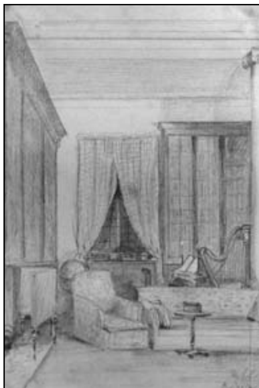
Figure 5 : La Bibliothèque de la famille de lord Durham à l'hôtel du Parlement de Québec. 31 octobre 1838. Mine de plomb sur papier bleu rehaussé de blanc, 24,2 x 16 cm, coll. Rideau Hall, Ottawa, prêt permanent du 11 e comte d'Elgin et 15 e comte de Kincardine, K.T. Signé : (coin inférieur droit) MLL/Oct. 31/38.

En voulant conserver le souvenir des lieux où elle a habité durant quelques mois, lady Mary Louisa s'est trouvée à réaliser des oeuvres dotées d'un intérêt historique certain. Non seulement ces aquarelles nous donnent-elles une idée de l'aménagement intérieur de l'ancien hôtel du Parlement de Québec, mais elles nous permettent de voir comment étaient logés nos anciens gouverneurs. Fait exceptionnel, lady Mary Louisa reviendra en Amérique du Nord quelques années plus tard. En effet, à l'automne 1846, elle épousera James Bruce (1811-1863), 8 e comte d'Elgin et 12 e comte de Kincardine, gouverneur général du Canada-Uni d'octobre 1846 à décembre 1854 13 . Devenue lady Elgin, Mary Louisa séjournera dans la colonie cette fois durant sept ans et, tout en occupant ses nouvelles tâches, elle continuera à s'adonner au dessin et à l'aquarelle 14 .