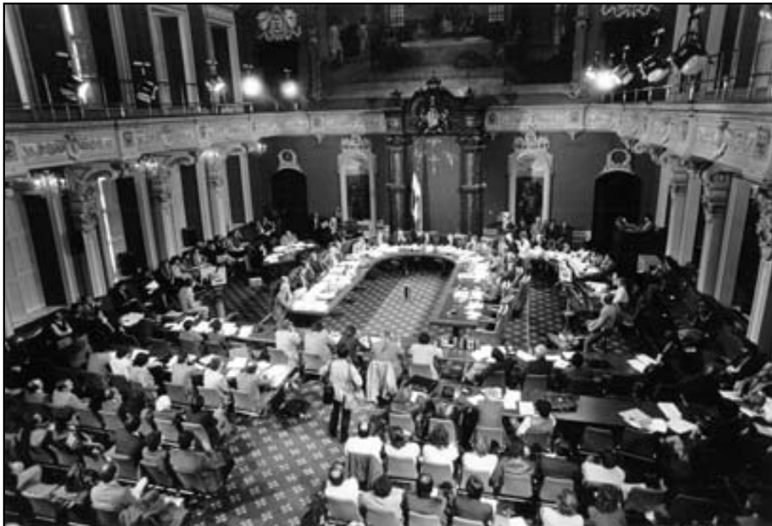
Les commissions parlementaires constituent, pour les députés, le lieu privilégié d'exercice de leur rôle de contrôleur de l'action gouvernementale. Lors de cette audience, en 1983, des représentants des autochtones et de divers groupes et organismes sur les droits et les besoins fondamentaux des Amérindiens et des Inuits témoignaient devant la Commission permanente de la Présidence du Conseil et de la Constitution.

La proportionnelle régionale proposée par le rapport Béland aurait surtout pour effet de renforcer la position du député à titre de législateur et de contrôleur du gouvernement. En effet, contrairement au mode de scrutin actuel, qui a invariablement engendré des gouvernements majoritaires au Québec depuis 1867, la représentation proportionnelle ferait souvent apparaître des gouvernements minoritaires ou de coalition. Toutefois, le choix d'un mode de scrutin ne doit pas dépendre de ses conséquences sur le rôle du député, mais bien de sa capacité à concilier la démocratie et l'efficacité de l'État. De ce point de vue, le mode de scrutin traditionnel n'est pas si mauvais qu'on le dit.