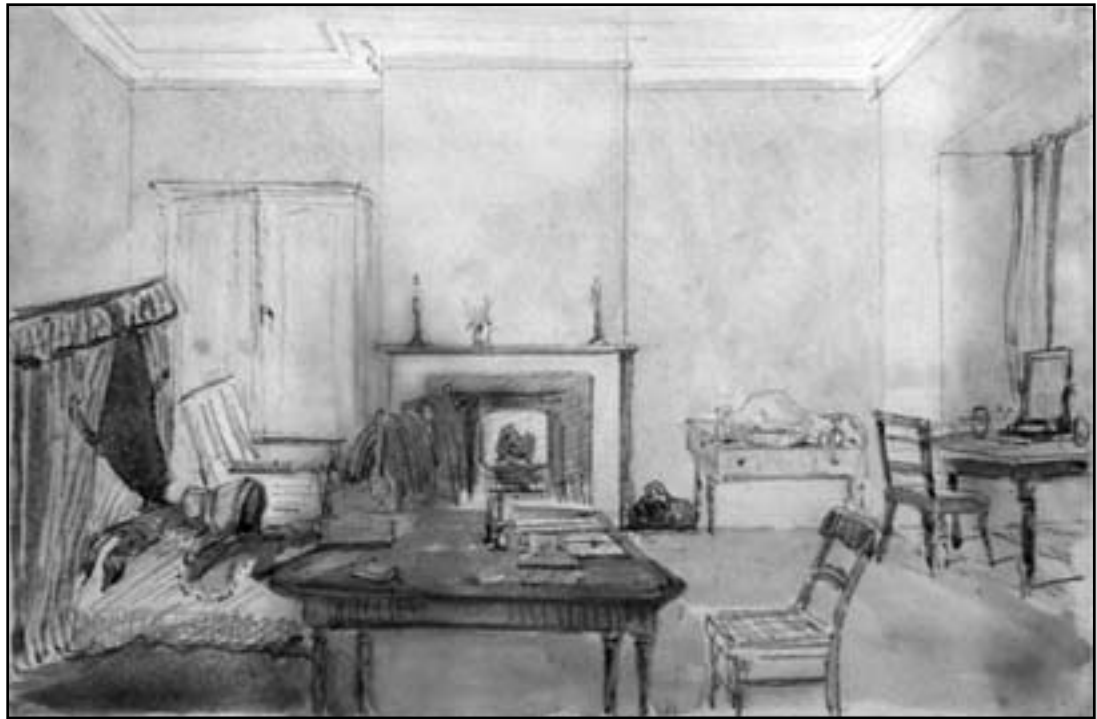
Figure 2 : La Chambre de lady Mary Louisa à l'hôtel du Parlement de Québec. 1838. Aquarelle sur mine de plomb, 16,1 x 24,2 cm, coll. Rideau Hall, Ottawa, prêt permanent du 11 e comte d'Elgin et 15 e comte de Kincardine, K.T. Non signé.

dans les appartements de l'hôtel du Parlement dont les aménagements ont été terminés durant leur absence. À propos des nouvelles installations, lady Durham note dans son journal personnel :