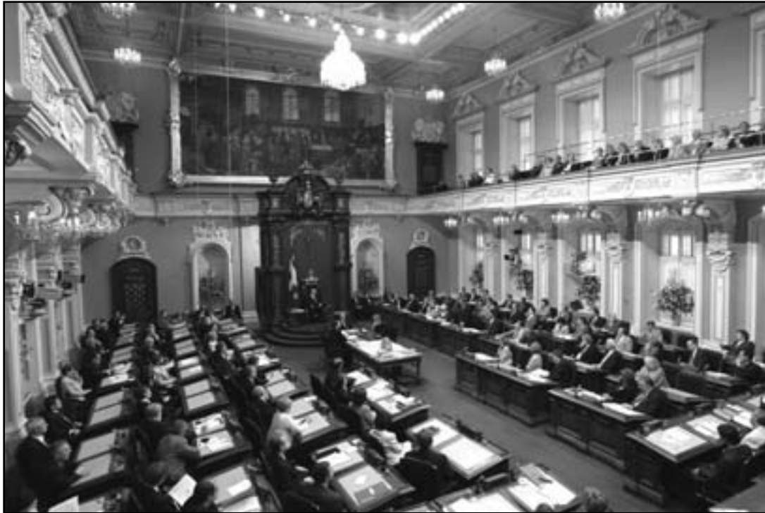
Les députés de l'Assemblée nationale du Québec à l'occasion du débat sur le discours d'ouverture de la 1 re session de la 37 e législature, en juin 2003.