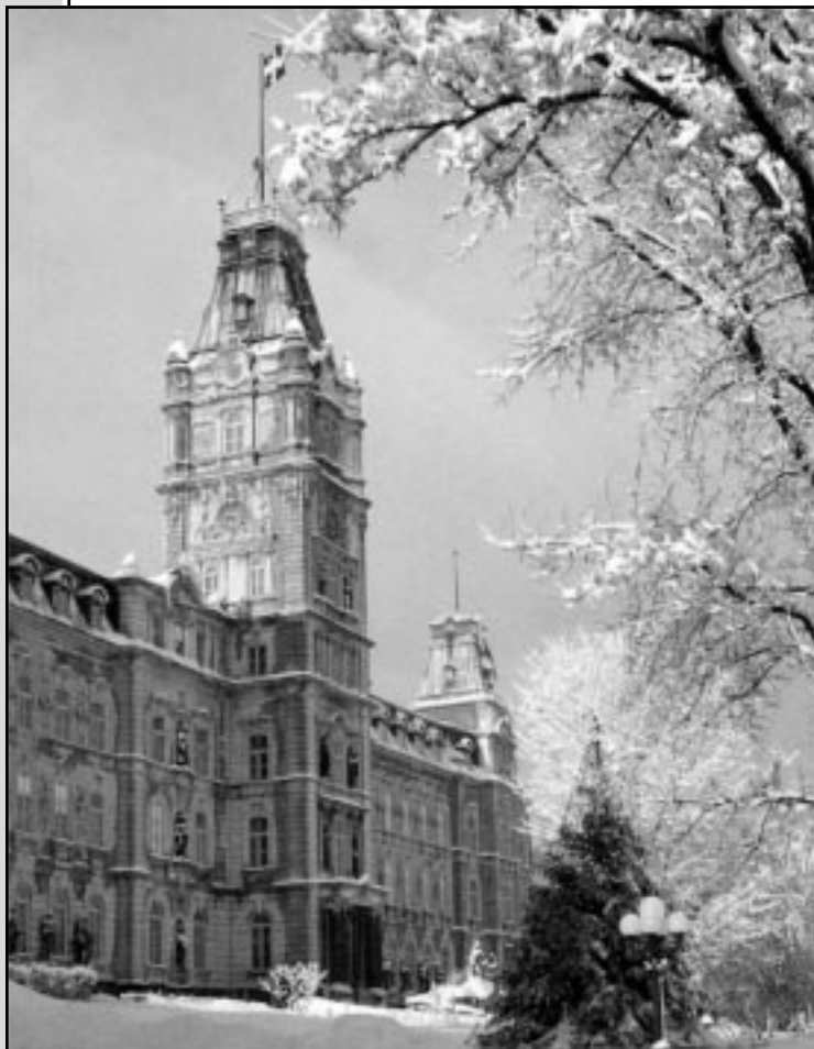
L'Hôtel du Parlement – scène d'hiver

VOLUME 30, NUMÉROS 3-4 QUÉBEC, DÉCEMBRE 2001