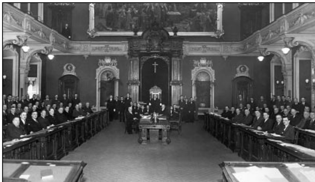
Les députés à l'Assemblée législative, 1944

possible que si les partis politiques et les électeurs eux-mêmes n'obligent pas les candidats, pour suffire à leurs dépenses d'élection, à hypothéquer en partant une