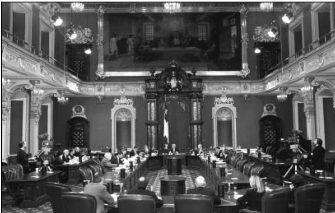
Une forme de participation politique : la consultation publique. Séance de la Commission des transports et de l'environnement, salle du Conseil législatif, 30 janvier 2001