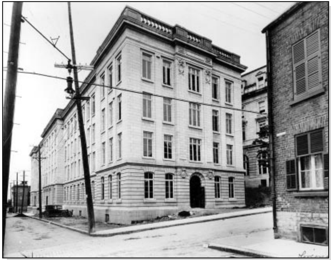
Édifice Honoré-Mercier (1925) peu après sa construction.