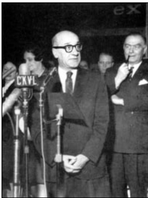
Georges-Émile Lapalme lors de la campagne électorale de 1956, dans Jean-Charles Panneton, Georges-Émile Lapalme : précurseur de la Révolution tranquille , Montréal, VLB Éditeur, 2000, « Études québécoises », n.p.

Dans les années 1950, le Parti libéral du Québec était pour ainsi dire le mandataire de ceux qui contestaient ou refusaient le