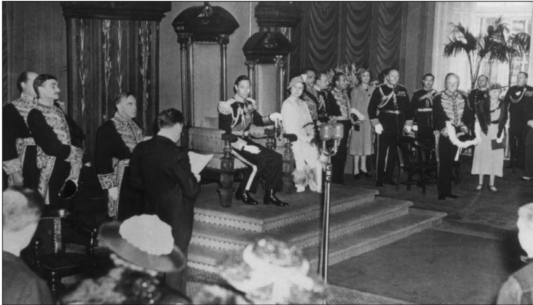
Dans la salle du Conseil, le 17 mai 1939, le premier ministre Duplessis lit une adresse au roi George VI. C'est la première visite d'un souverain britannique au Canada. L'épouse du souverain occupe le fauteuil de l'Orateur du Conseil..

intermédiaires, les minorités, les agents de l'économie et les représentants des professions, avec des structures et des pouvoirs conformes aux besoins de son époque 60 .