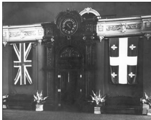
Un fait unique: le drapeau du Québec (créé en 1948) et l'Union Jack exposés à l'arrière de la Salle du Conseil législatif, probablement pour une réception dans les années 1950.

Dans un cahier spécial sur l'ÉNAP, publié le 19 mars 1994, Le Devoir posait la