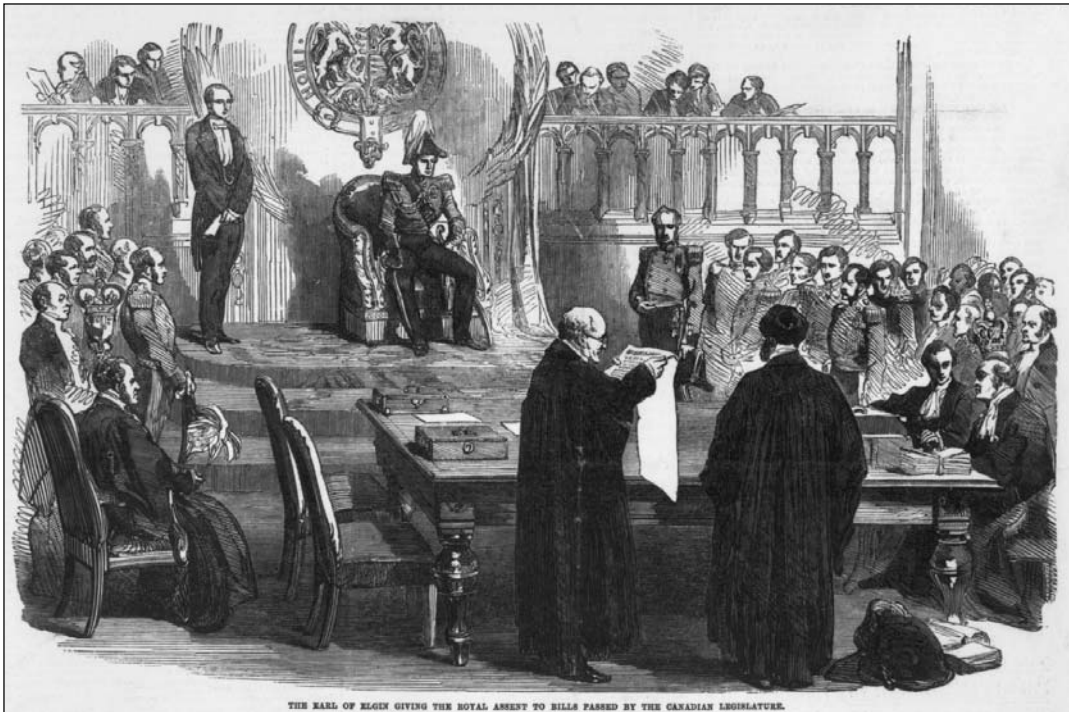
Une cérémonie de sanction dans la Salle du Conseil législatif du Canada-Uni, à Québec, en 1854. Le greffier du Conseil informe le gouverneur Elgin des projets de loi à sanctionner. L'Orateur du Conseil est assis à gauche, flanqué de son sergent d'armes. La présence du sergent d'armes de l'Assemblée, à l'autre extrémité de la table, porte à croire que l'un des personnages assis à droite est l'Orateur de l'Assemblée. ( Illustrated London News , 20 janvier 1855)

La Confédération de 1867 maintient l'institution. En vertu de l'article 71 de l' Acte de l'Amérique du Nord britannique (AANB), la Législature de Québec, contrairement à celle de l'Ontario, est constituée du lieutenant-gouverneur, de l'Assemblée législative et du Conseil législatif. George-Étienne Cartier est responsable du maintien de cette Chambre dans nos institutions. Alors que John A. Macdonald considère que les provinces n'en ont pas besoin, Cartier défend le bicaméralisme pour mieux marquer l'autonomie et le caractère particulier du Québec. De plus, il est convaincu que la population du Bas-Canada est beaucoup plus monarchiste que celle du Haut-Canada et qu'elle apprécie davantage les institutions monarchiques 3 . Le Canadien y voit «une barrière que l'on met à l'extension de notre influence, c'est une forteresse que l'on érige sur notre domaine et dont la garnison anglaise tiendra nos forces en échec 4 ». Pour plusieurs, le Conseil est créé afin de donner une meilleure représentation à la minorité anglaise du Québec qui craint de se voir lésée par la