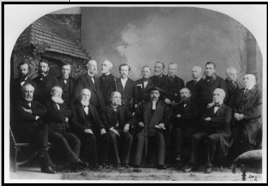
Conseillers législatifs de la province de Québec, 1883

VOLUME 27, NUMÉROS 3-4 – QUÉBEC, DÉCEMBRE 1998