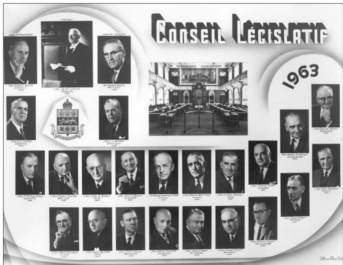
La mosaïque du Conseil en 1963.

tentative. Le gouvernement Lesage craint que le rapatriement de la Constitution - on est en plein débat sur la formule Fulton-Favreau - ne rende intangibles les pouvoirs du Conseil législatif sur les projets de loi votés par l'Assemblée législative. On craint surtout que celui-là s'oppose à la nouvelle formule d'amendement approuvée par le gouvernement 24 . Un projet de loi est alors présenté pour limiter les pouvoirs du Conseil législatif. La loi est votée par l'Assemblée, mais édulcorée par le Conseil 25 . Comment sortir de l'impasse? Lesage demande au juriste Louis-Philippe Pigeon de trouver un moyen. Pigeon reprend l'idée de Mercier et suggère de faire parvenir une adresse à la reine 26 . Finalement, ce n'est pas une, mais deux adresses qui se retrouvent à Londres. Celle de l'Assemblée qui demande de limiter les pouvoirs du Conseil par une loi britannique et celle du Conseil qui s'y oppose 27 , les deux sans succès. Dans certains