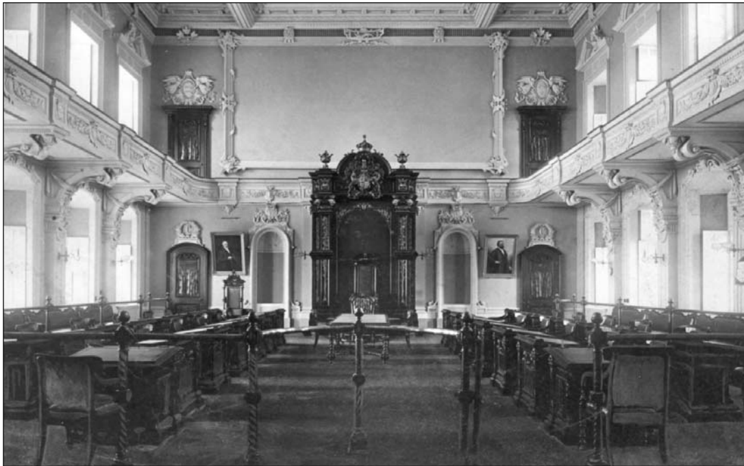
La salle du Conseil vers 1900, le tableau d'Henri Beau n'étant pas encore installé (1904). On remarque la présence du fauteuil du lieutenant-gouverneur à la place du fauteuil du président du Conseil qui se trouve à gauche, sous le portrait d'un ancien orateur. (coll. ANC, PA-23976)

libéraux n'ont guère apprécié que le Conseil torpille leur réforme de l'éducation. Le projet de loi franchit l'étape de la première Chambre, mais échoue au Conseil. Thomas Chapais, probablement le conseiller législatif le plus connu, prononce à cette occasion un discours célèbre qui est demeuré la défense la plus solide de cette institution tant décriée 14 . Les libéraux dirigés par Gouin et Taschereau, qui finissent par jouir d'une large majorité dans les deux chambres, s'opposent à tout projet d'abolition. En 1919, les conservateurs, depuis plusieurs années dans l'opposition, réclament une réforme du Conseil ou son abolition 15 . En 1931, dirigés par Camilien Houde, ils se contentent d'exiger une réforme de la « constitution du Conseil législatif » de façon à mieux servir les intérêts de la province 16 .