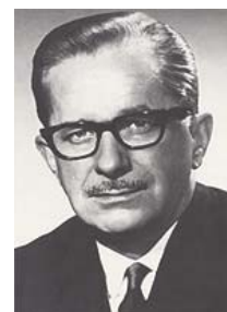
Premier ministre du Québec (1966-1968)