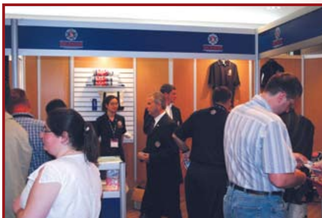
Congrès de l'ACSIQ – Mai 2007