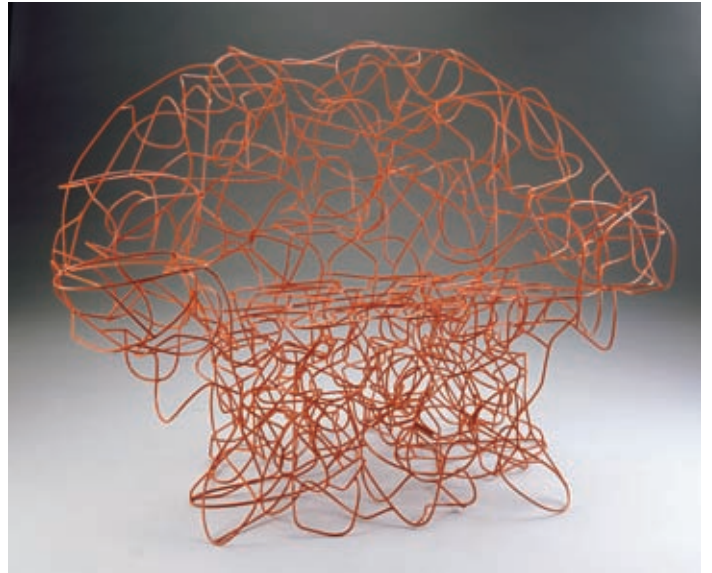
Fernando et Humberto Campana Chaise Corallo , 1993-1998 Don de Edra S.p.A.