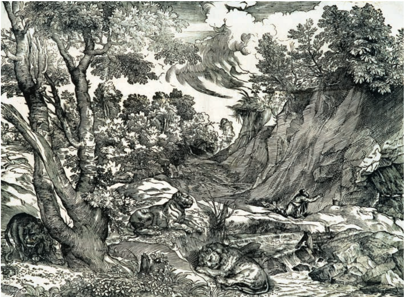
Tiziano Vecellio, dit Titien Saint Jérôme dans le désert, vers 1530 Achat, fonds anonyme