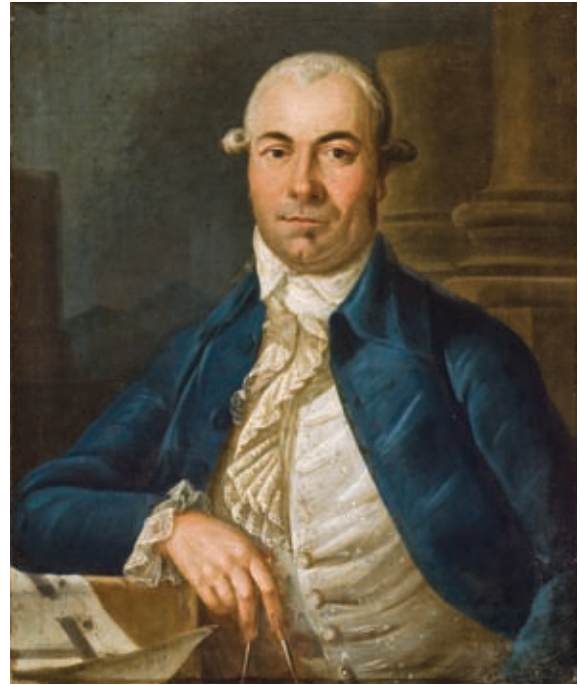
François Malepart de Beaucourt Portrait d'un franc-maçon, Vénérable Maître d'une loge maçonnique au Cap-François (Saint-Domingue, actuel Haïti), 1787 Achat, legs Horsley et Annie Townsend