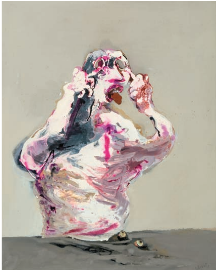
Paul Rebeyrolle Évidemment , 1987 Don de M. et Mme Alain Gourdeau © Succession Paul Rebeyrolle / SODRAC (2007)