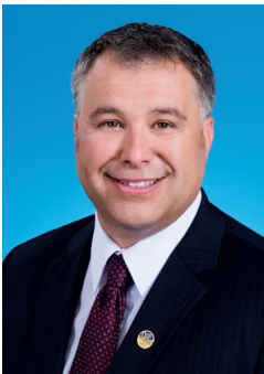
Sébastien Proulx Ministre de l'Éducation, du Loisir et du Sport Ministre responsable de la région de la Capitale-Nationale

L'engagement et la mobilisation des partenaires de l'éducation, de l'enseignement supérieur, du loisir et du sport sont essentiels à l'atteinte des objectifs de ce nouveau plan stratégique. Nous pourrons relever avec brio les nombreux défis qui nous attendent en mettant en commun nos compétences et notre énergie. Nous souhaitons travailler en partenariat avec tous les acteurs impliqués dans nos sphères d'activité, y compris les parents, afin d'offrir aux jeunes des milieux de vie et d'apprentissage innovants, stimulants, accueillants et sécuritaires.