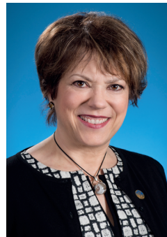
Hélène David Ministre de l'Enseignement supérieur Ministre de la Condition féminine