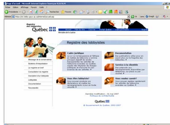
Figure 1 : Page d'accueil du site Web

institutions, de quelle manière, à quel sujet et dans quel but.