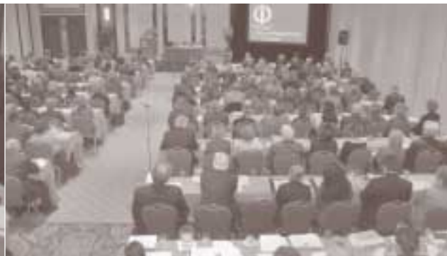
Vue des 200 participants lors de la formation du 13 mars 2007.