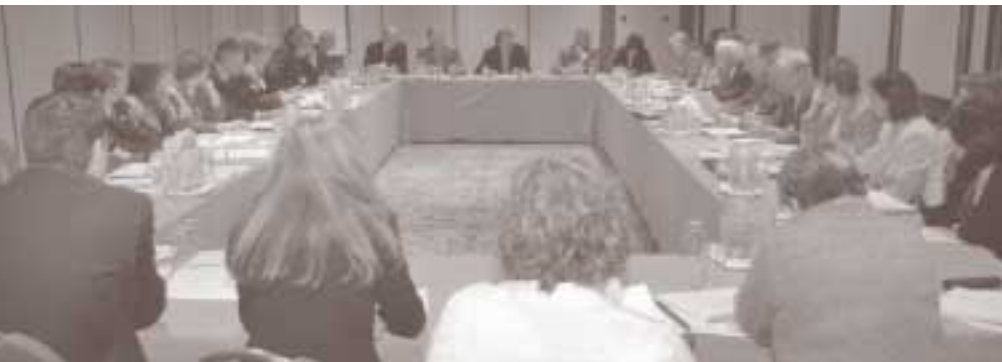
Travaux en atelier lors de la formation du 13 mars 2007.