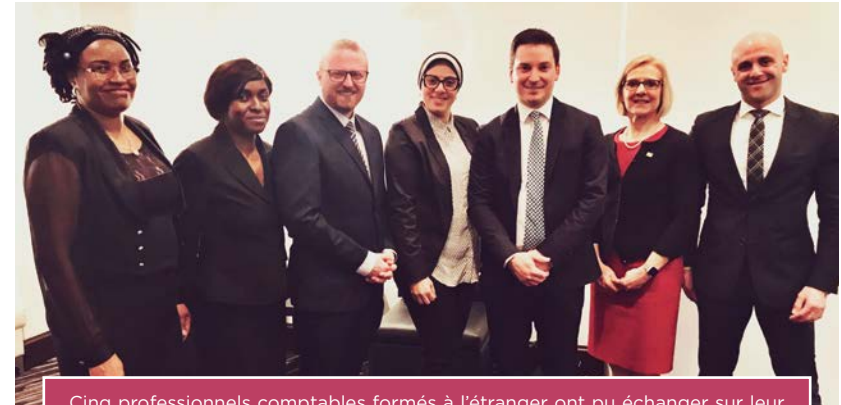
Cinq professionnels comptables formés à l'étranger ont pu échanger sur leur parcours menant à l'obtention du titre de CPA avec le ministre Simon Jolin Barrette lors de son passage sur la tribune du CORIM.

Alors que l'immigration et la pénurie de main-d'œuvre figurent parmi les sujets de l'heure au Québec, l'Ordre s'est donné pour objectif d'être à l'avant-garde en matière d'évaluation des compétences et d'accompagnement des professionnels formés à l'étranger. En d'autres termes, nous voulons faire partie de la solution et non pas du problème.