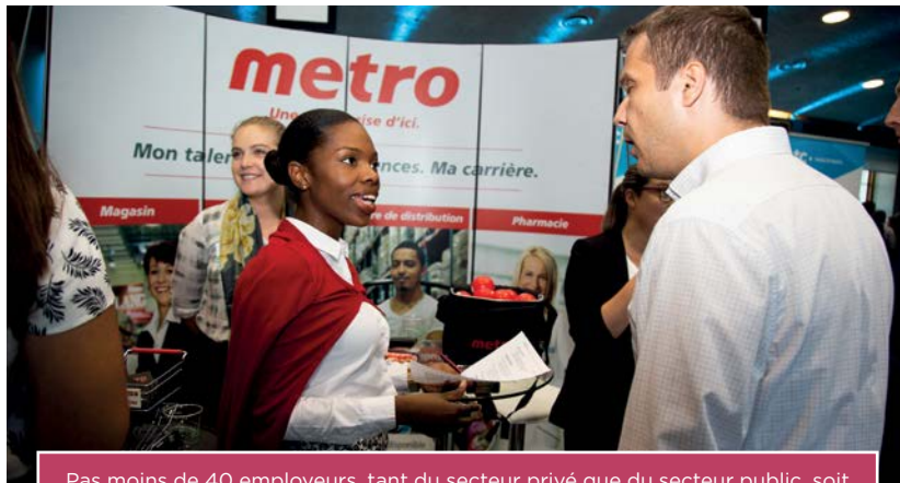
Pas moins de 40 employeurs, tant du secteur privé que du secteur public, soit 10 de plus que l'an dernier, ont participé à l'événement de recrutement tenu à Montréal.

Avec à peine 2 % des CPA qui sont sans emploi, la profession est clairement en situation de plein emploi. Il n'est donc pas surprenant que le nombre de postes affichés sur Emploi CPA soit en hausse constante; au cours de la dernière année, il est passé de 1 831 à 1 984, soit une progression de 8 %. On ne s'étonne pas non plus de constater que les employeurs s'activent pour recruter la relève et sécuriser leur bassin de ressources humaines.