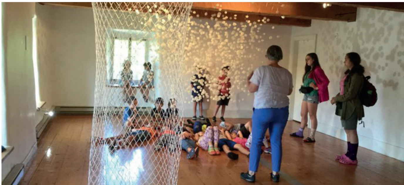
Projet soutenu par l'entremise des ententes de développement culturel.

Le 27 septembre 2019, le Ministère lance le Cadre de référence : ententes de développement culturel : pour un partenariat souple et coopératif avec le milieu municipal, par lequel il réaffirme l'importance du partenariat avec les gouvernements de proximité en matière de culture et de communications. En janvier 2020, le budget disponible pour la conclusion d'ententes est bonifié de manière importante : plutôt que les 9 M$ prévus annuellement, c'est l'équivalent de 14 M$ qui sont injectés par le Ministère dans les ententes de développement culturel pour l'exercice 2019-2020.