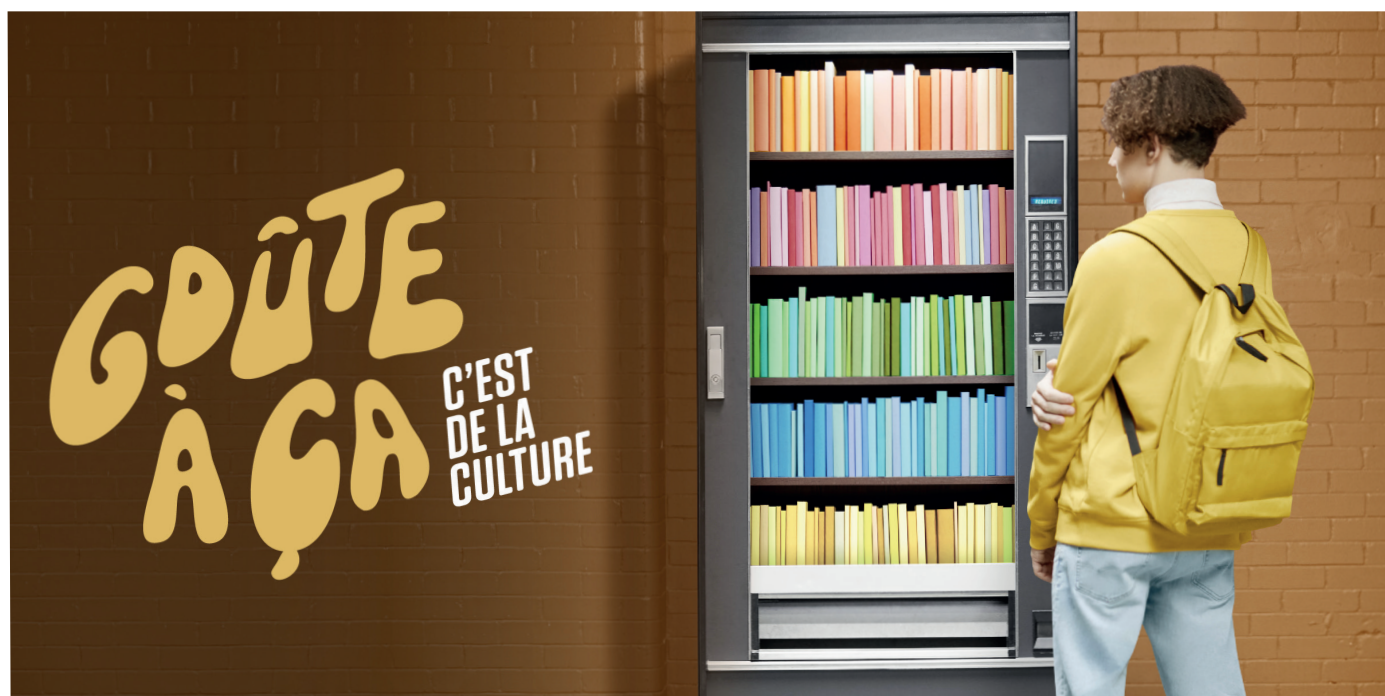
Campagne promotionnelle Goûte à ça, c'est de la culture.

En outre, en 2019, le Ministère et le ministère de l'Éducation et de l'Enseignement supérieur mettent en place la campagne Goûte à ça, c'est de la culture, qui vise à transmettre aux jeunes le goût de la culture.