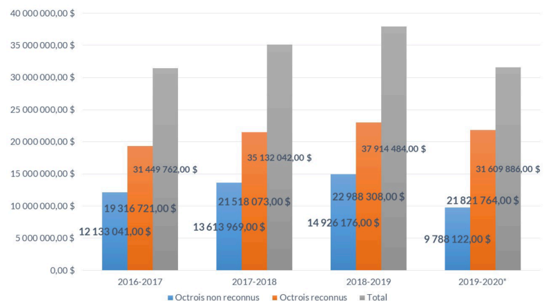
Total des fonds

*Les données pour l'année 2019-2020 ne représentent pas une année complète.