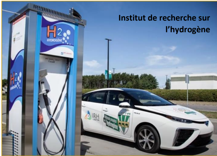
Institut de recherche sur l'hydrogène