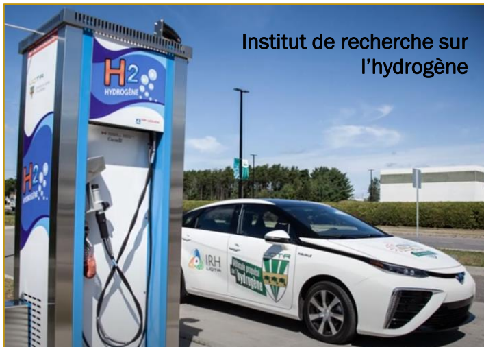
Institut de recherche sur l'hydrogène