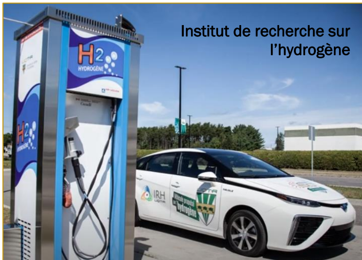
Institut de recherche sur l'hydrogène