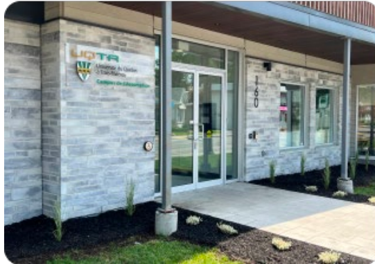
Campus de L'Assomption, ouverture officielle en août 2022