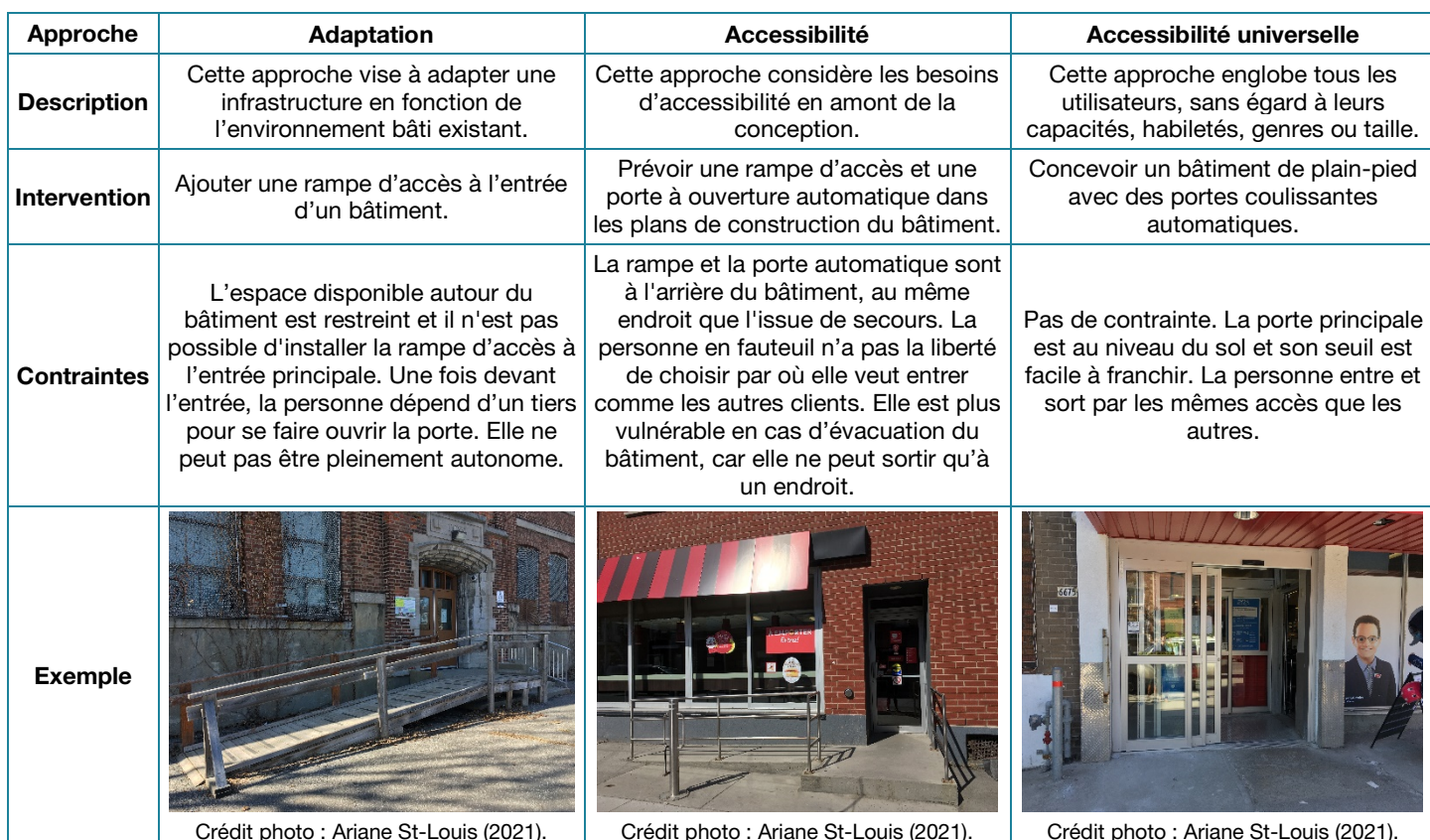
Figure 1 Accéder à un bâtiment en fauteuil roulant : approches d'accessibilité et contraintes associées

L'aménagement peut autant favoriser la pleine participation des individus à la vie en collectivité que les en exclure. Les concepts clés présentés dans cette section, soit l'adaptation, l'accessibilité et l'universalité, ont pour objectif de guider la réflexion sur ce qu'est la conception accessible et inclusive. La figure 1 illustre les différences selon l'approche de conception choisie et les contraintes qui pourraient y être associées pour une même situation : accéder à un bâtiment en fauteuil roulant.