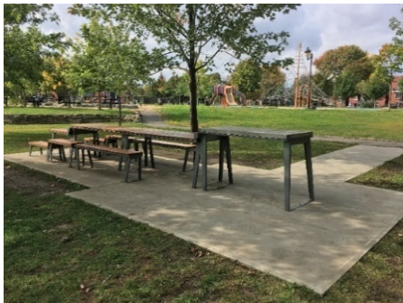
Figure 2 Des exemples qui intègrent les principes du design universel

La table à pique-nique et son usage sont faciles à reconnaître ( utilisation simple et intuitive ). Elle est accessible aux enfants, aux personnes à mobilité réduite et aux groupes. Elle s'utilise en position assise ou debout, qu'importe le besoin ressenti ou la difficulté à s'asseoir ou à se relever ( utilisation flexible ). Il est possible d'accéder à la table par l'herbe ou par un chemin d'accès relié à la dalle de béton qui inclut une aire de manœuvre ( utilisation facile d'approche ). Les bancs sont rivés au sol pour minimiser le risque de basculer ( utilisation sécuritaire et tolérance à l'erreur ).