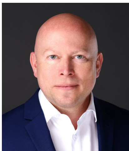
Stéphane Pallage Recteur

comment l'UQAM peut-elle mieux servir le Québec. Le résultat est un plan ambitieux pour l'Université, qui s'apprête à vivre de grands développements au bénéfice du Québec.