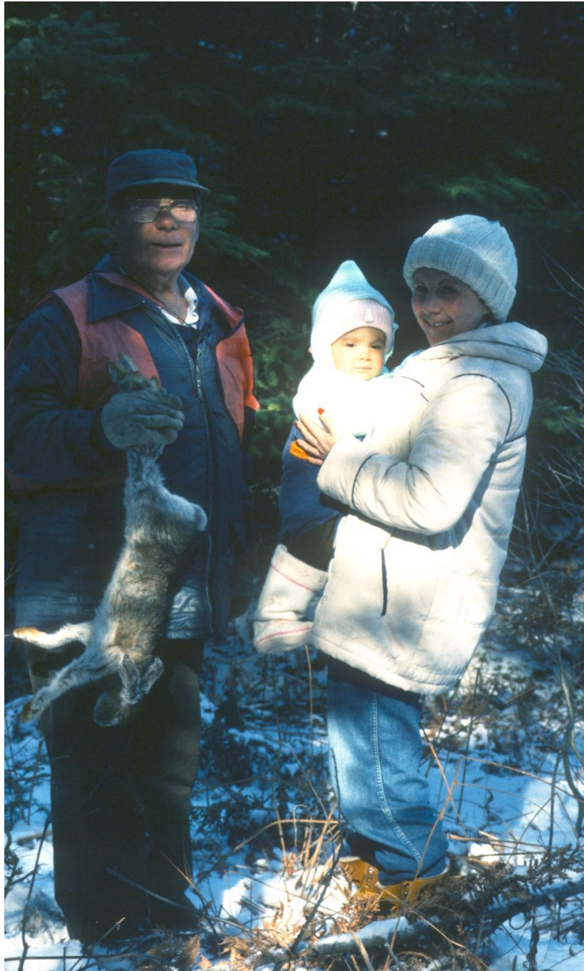
« Trois générations de W8linakiak de retour de chasse à proximité de la SPIPB, vers 1985 »

« Ils ne pourront jamais compenser tout ce qui est en train d'être détruit ici... » - Aîné de Wôlinak qui fréquente la zone d'étude depuis qu'il a 8 ans, en parlant de la filière batterie