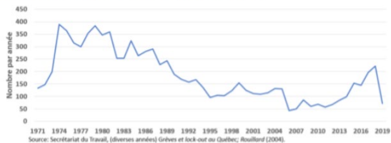
Graphique 6 : Arrêts de travail au Québec, 1971-2019