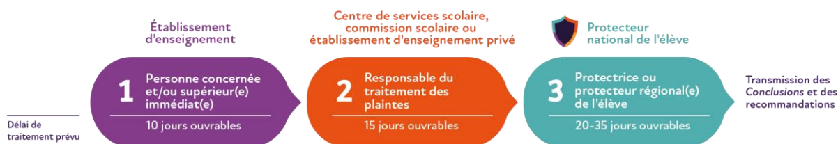
Figure 1 : Procédure de traitement des plaintes et des signalements

Mentionnons qu'en matière d'acte de violence à caractère sexuel, l'élève, le parent ou toute personne signalante peut passer directement à la protectrice ou au protecteur régional de l'élève.