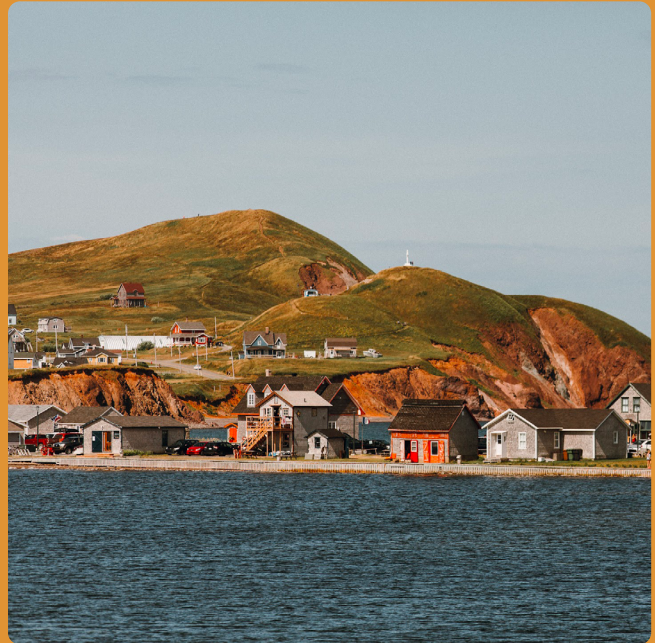
Photos : Îles-de-la-Madeleine

gestion des déchets, ces facteurs contribuent à l'augmentation du coût de la vie aux Îles-de-la-Madeleine et par le fait même à la pleine participation de ces nouveaux arrivants à la vie en communauté.