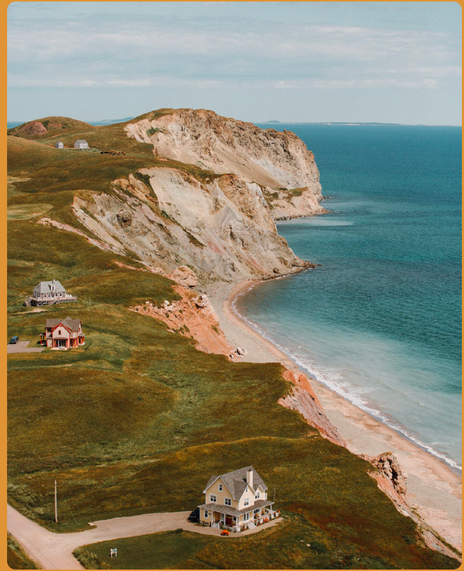
Photo : Îles-de-la-Madeleine