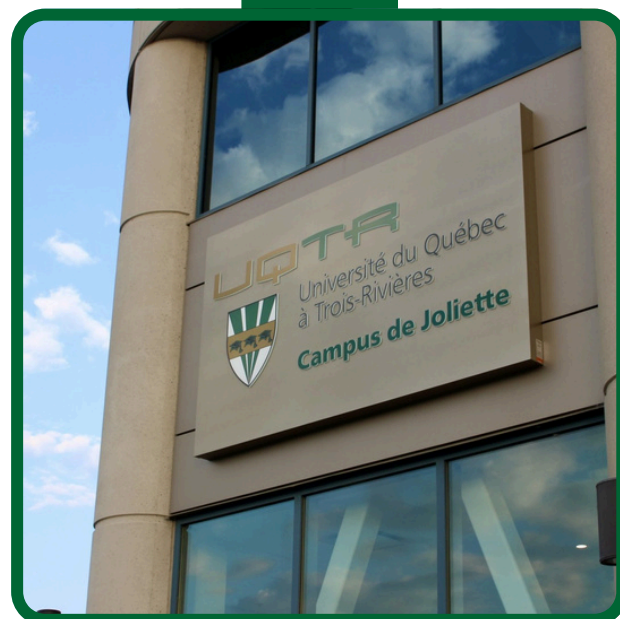
Inauguration du nouveau campus de Joliette, 5 septembre 2024

En vertu de l'Article 4.1 de la Loi sur les établissements d'enseignement de niveau universitaire