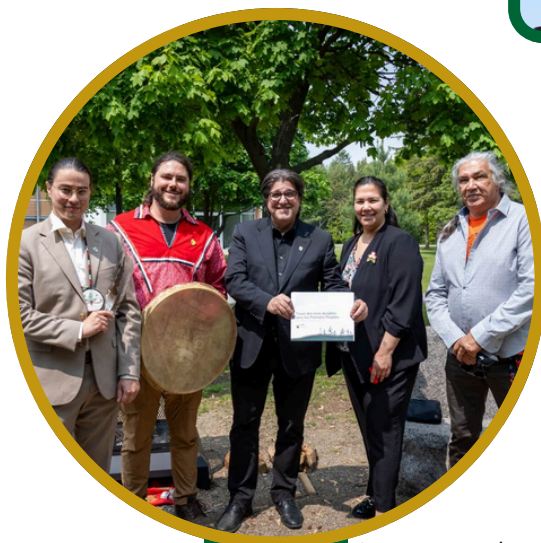
Lancement du tout premier Plan stratégique autochtone à l'UQTR, adopté 24 mars 2025