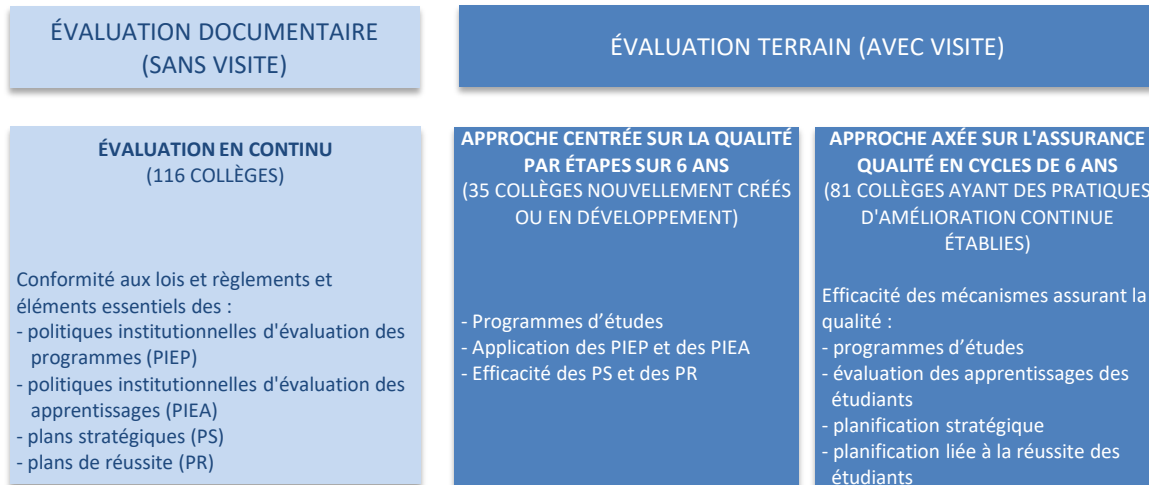
Schéma 1 – Opérations d'évaluation menées par la Commission *

* La Commission évalue en continu l'efficacité potentielle des politiques institutionnelles d'évaluation des apprentissages (PIEA) et des politiques institutionnelles d'évaluation des programmes (PIEP) de tous les collèges (depuis 1993), les plans de réussite des cégeps et des collèges privés subventionnés (depuis 2002) et les plans stratégiques des cégeps (depuis 2004). Dans tous les cas, elle se prononce sur les éléments qu'ils doivent contenir pour favoriser leur mise en œuvre efficace. Elle évalue également l'efficacité réelle de ces politiques et plans, à travers des opérations d'évaluation qui se déroulent sur place, et ce, selon une approche centrée sur la qualité ou une approche axée sur l'assurance qualité.