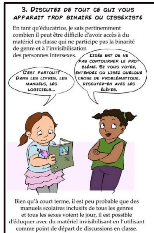
Fig. 1. Exemple d'activisme anti- binaire ou contre la réalité biologique des garçons et des filles 22 .

D'autres outils, comme la licorne du genre et la personne gingenre, largement utilisées dans nos écoles, servent également à faire la promotion d'une vision non binaire du sexe et de la sexualité dans nos écoles (fig. 2).