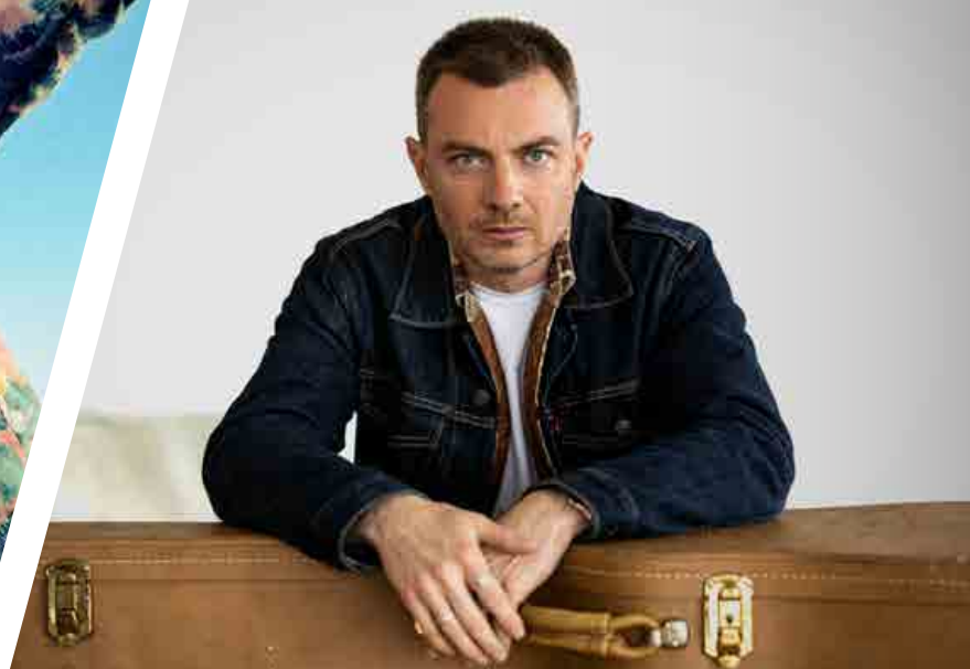
Jordan Officier