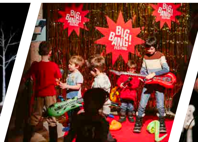
Big Bang Photo : Stéphane Bourgeois