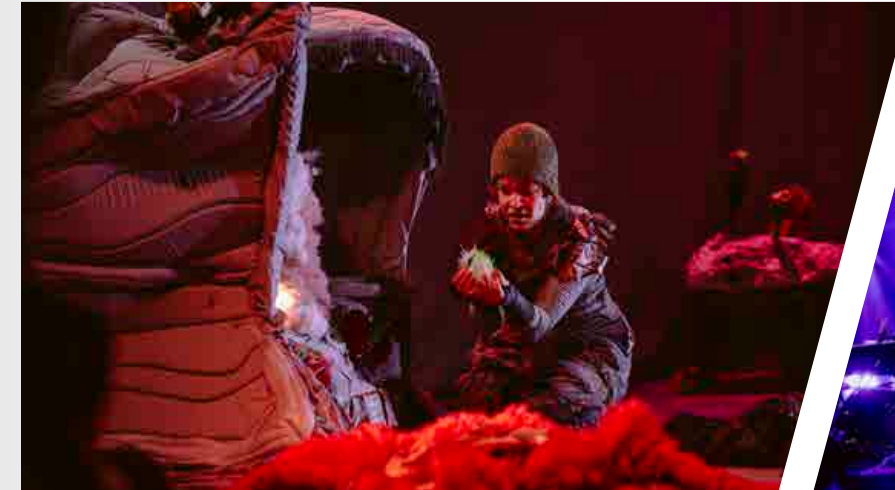
Soudain les îles