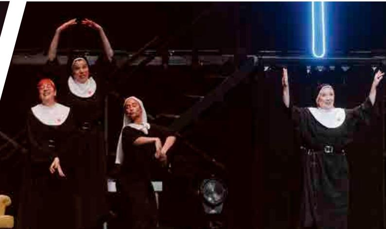
Les Nonnes