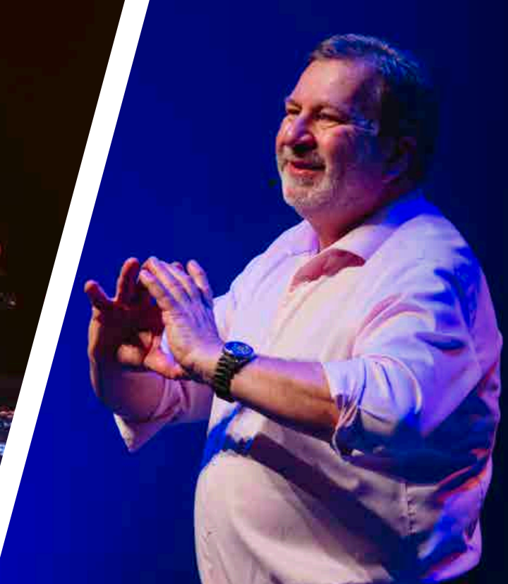
Alan Lake Factorie