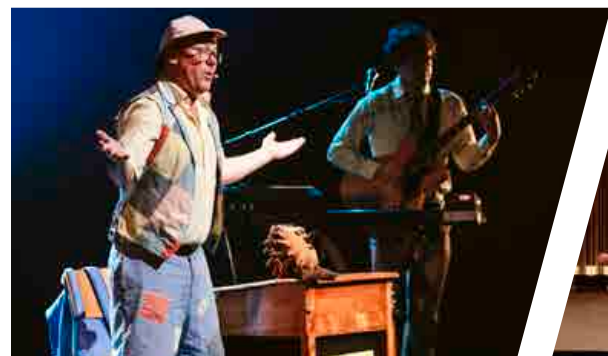
Kid Kouna