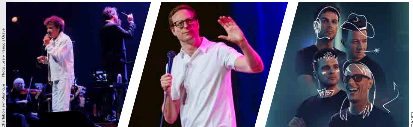
Charlebois symphonique