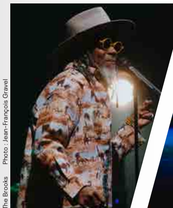
The Brooks