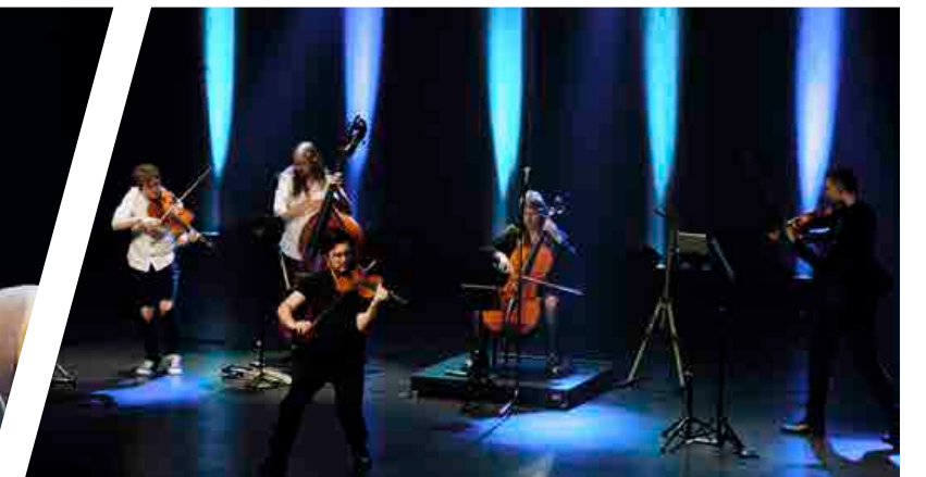
Wooden Shapes