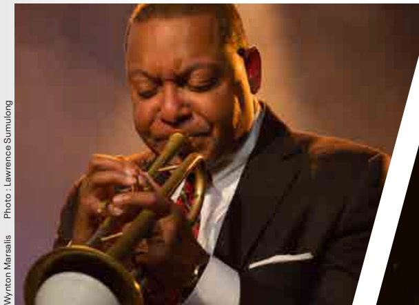
Wynton Marsalis