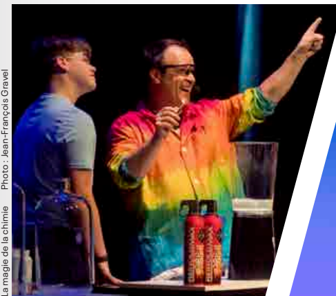
La magie de la chimie