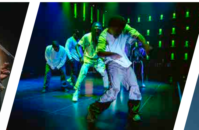
JOAT en tournée