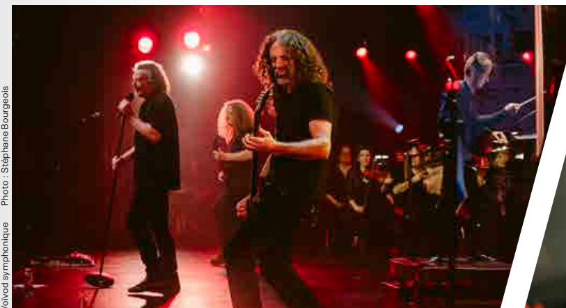
Voivod symphonique