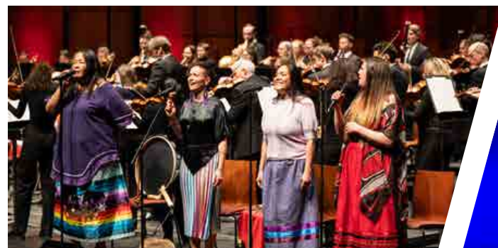
La Neuvième - Artistes Inuit Premières Nations