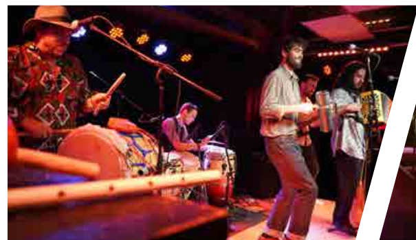
Less Toches