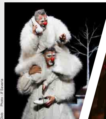
Glob Photo : JF Savaria