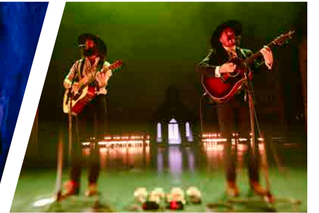
The Dead South