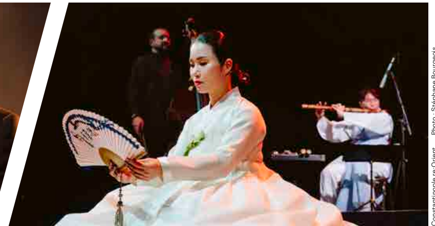
Constantino re-Orient