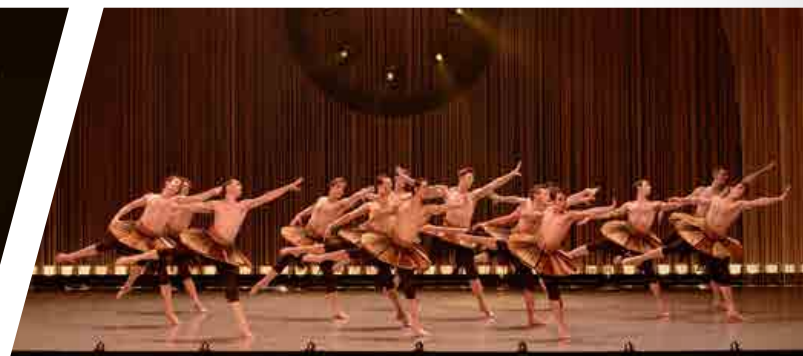
Grands Ballets Canadiens, Danser Beethoven