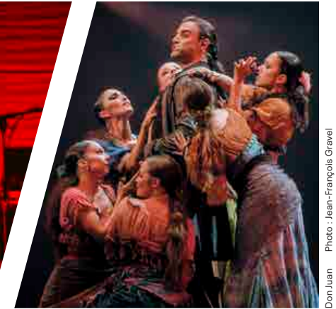
Don Juan Photo : Jean-François Gravel