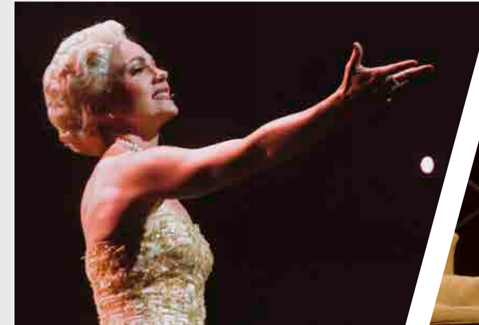
Lili St-Cyr