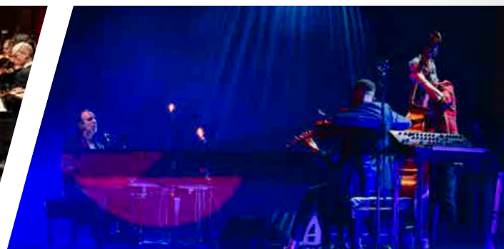
Chilly Gonzales