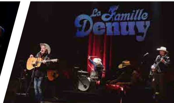
La Famille Denuy