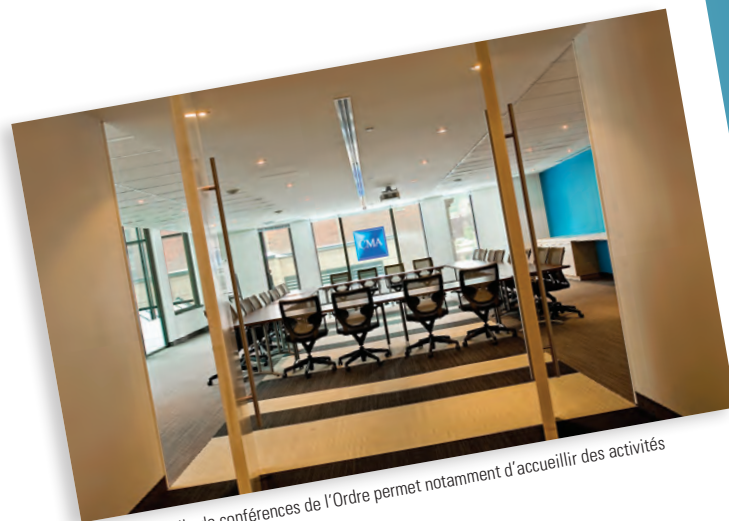
La nouvelle salle de conférences de l'Ordre permet notamment d'accueillir des activités de formation continue.

Au Québec et au Canada, comme l'annonce en a été faite récemment, l'unification est à l'ordre du jour. Faut-il s'en étonner quand ce printemps même, on a assisté à l'union de l'AICPA - les CPA américains - avec le Chartered Institute of Management Accountants (CIMA) - nos cousins CMA d'Angleterre? C'est une première historique et un signe des temps.