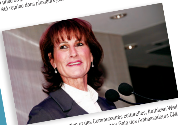
La ministre de l'Immigration et des Communautés culturelles, Kathleen Weil, a honoré de sa présence les invités au premier Gala des Ambassadeurs CMA.