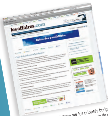
La prise de position de l'Ordre sur les priorités budgétaires du Québec a été reprise dans plusieurs journaux à la veille du dépôt du budget.

Il faut dire que la saine gestion de l'Ordre lui permet en quelque sorte de prêcher par l'exemple, lui qui s'inspire des meilleures pratiques des organismes sans but lucratif en matière de gestion budgétaire et financière. Nous avons d'ailleurs adopté, au cours de l'année, une politique de gestion de l'actif net visant à porter l'avoir des membres à 20 % des revenus annuels à moyen terme. C'est précisément cette rigueur qui nous autorise à faire des projets d'avenir. Et nous en avons!