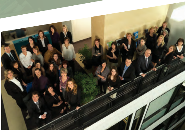
Photo de la couverture : Paul Labelle, photographe, avec la complicité de l'ensemble des membres du personnel de l'Ordre dans ses nouveaux locaux.

Cette performance est une fois de plus une source de fierté pour toute l'équipe de l'Ordre, une équipe élargie et orientée vers le développement et l'affirmation de la profession, comme le prévoient tant le plan stratégique triennal que la nouvelle structure organisationnelle. C'est d'ailleurs dans cette perspective que l'Ordre a emménagé dans de nouveaux locaux au cours de la dernière année, afin de répondre aux impératifs de la croissance et du développement de la profession, et de maintenir la qualité de ses services au plus haut niveau.