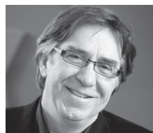
Claude Provencher Architecte Provencher Roy + associés architectes