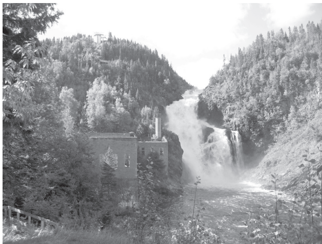
Village historique de Val-Jalbert. Jean-François Rodrigue 2007, © Ministère de la Culture et des Communications

Le ministre a également sollicité l'avis du Conseil sur plusieurs dossiers majeurs dans la grande région de Montréal. Il y a notamment lieu de mentionner l'aménagement d'un nouveau tronçon du sentier de ceinture sur le mont Royal, la construction d'un hôtel intégrant l'édifice du Mount Stephen Club, le réaménagement des berges du canal de Beauharnois, la démolition d'un bâtiment situé dans l'aire de protection de l'édifice de la Unity Building et la construction d'un immeuble de 40 mètres sur la rue McGill.