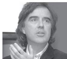
Pierre Thibault Architecte L'Atelier Pierre Thibault inc.