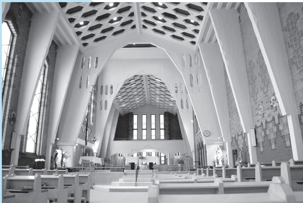
Chapelle de l'Oratoire-Saint-Joseph, Saguenay.