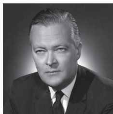
Photo Gaby (Gabriel Desmarais) Juillet 1971 Bibliothèque et Archives nationales du Québec Centre d'archives de Montréal Fonds Gabriel Desmarais (Gaby) P795, S1, D15871, P3

Premier ministre du Québec 1970-1976, 1985-1994