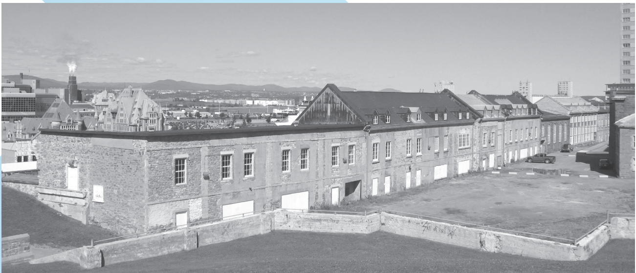
Les Nouvelles-Casernes, Québec.

Fort de son héritage de 90 années, le Conseil du patrimoine culturel aborde l'avenir avec la conviction profonde que le patrimoine culturel constitue un actif pour une société et qu'il s'avère aussi un puissant facteur identitaire. Il faut d'ailleurs souligner la reconnaissance par le Législateur du patrimoine culturel immatériel, considéré à juste titre par l'UNESCO comme un facteur contribuant au maintien de la diversité culturelle face à la mondialisation croissante.