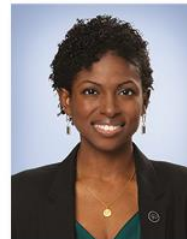
Madwa-Nika Cadet Membre Députée de Bourassa-Sauvé