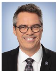
Stéphane Sainte-Croix Membre Député de Gaspé